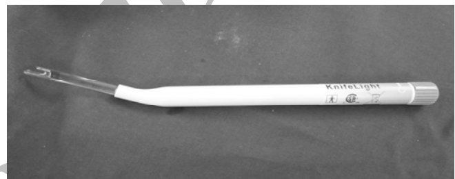
شکل ۲: ابزار جراحی نایف لایت (Stryker Co)

آزاد و سطح زیرین نیز با استفاده الواتور Freer از سینیوم آزاد می‌گردید. نوک U شکل ابزار جراحی (شکل ۲) روی لبه دیستال ۲/۳ باقیمانده لیگامان عرضی کارپال قرار داده می‌شد و در امتداد منطقه امن (۷) و تا حد چین پروکسیمال عرضی مچ دست به جلو هدایت می‌گردید. هنگام خارج کردن ابزار از روشنایی (Illumination)، تیغه آن برای کنترل قطع کامل TCL استفاده می‌شد (لازم به توضیح است که نوک این ابزار جراحی علاوه بر وجود یک چاقو که مسئول بریدن TCL می‌باشد با کمک یک باتری و ایجاد روشنایی قادر به ارزیابی ضخامت بافت نرم در موضع نیز می‌باشیم).