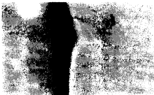
شکل ۲: ژل پروفایل لیئوفوسفولیکان (LPG) خالص شده با ژل پروفایل استاندارد که پس از کروماتوگرافی روی سفادکس G-150 و رسوب در متانول سرد، LPG برای SDS-PAGE مورد استفاده قرار گرفت.

بود و بقیه Peak ها جمع آوری و لیوفیلیزه شد. در مجموع از ۵ میلیارد لپتوموناد فرم لگاریتمی حدود ۱ گرم LPG خالص تهیه شد که برای اثبات خلوص آن ابتدا یک کروماتوگرافی روی سفادکس G-150 به همراه متانول سرد و سپس یک SDS PAGE انجام گرفت که در ستون اول ژل با نقره رنگ آمیزی شده که ماده اولیه بوده و بیانگر وجود پروتئین در LPG است و ستون دوم و سوم با PAS رنگ می شود که بیانگر وجود کربوهیدراتها و LPG و خلوص آن است (۱۸) (شکل ۲).