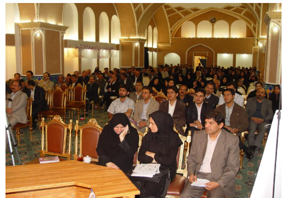
برگزاری مراسم جشن پژوهش

. مقالات چاپ شده در مجلات علمی معتبر داخلی