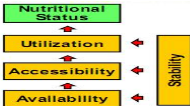
شکل 1: عوامل موثر بر امنیت غذایی و تغذیه

Food Availability در تعریف عبارت است از موجود بودن غذا در سطح منطقه بواسطه تولید مواد غذایی ، واردات مواد غذایی ، کمک های غذایی و یا ذخایر مواد غذایی (12).