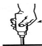
دسته صاف سطح افقی زیر ارتفاع آرنج