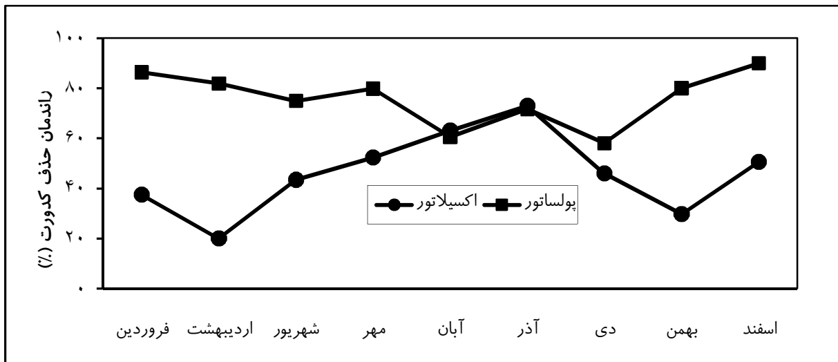
نمودار(۲): نوسانات راندمان دو سیستم اکسیلاتور و پولساتور در حذف کدورت در ماه های مورد مطالعه