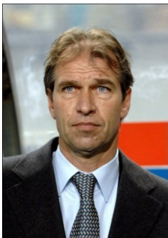
تصویر ۱۰. پیم وربیک (Pim Verbeek) مربی هلندی