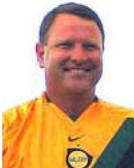
تصویر ۷. استیوسمپسون (Steve Sampson) مربی آمریکایی

مواجه شدیم. دیدن این صحنه به هر کسی که ایرانی بود احساسی از غرور می‌داد و من هم یک ایرانی بودم. وقتی توپ به طرف حمید استیلی رفت می‌دانستم چه اتفاقی می‌افتد و وقتی استیلی گل زد نمی‌دانستم باید چکار کنم، گریه کنم یا هورا بکشم؟! نشستم و به روبرو خیره شدم. آن روز تمام مردم ایران در کشور از تیم ایران حمایت می‌کردند و این پیروزی به آنها روحیه داده بود. ۱ پس از شکست تیم ملی فوتبال آمریکا در مقابل تیم ایران، استیوسمپسون استعفا داد و من هم از تیم آمریکا جدا شدم. ۲ »