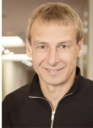
تصویر ۲۲. یورگن کلینزمن (Jurgen Klinsmann) بازیکن و مربی آلمانی

نیست که مربیان خارجی مانند آمریکایی‌ها یا ایرانی‌ها بتوانند در آن کار کنند. ۱