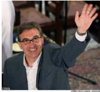
تصویر ۱۲. برانکو ایوانکوویچ (Branco Ivankovic) مربی کروات

برانکو ایوانکوویچ، سرمربی پیشین تیم ایران پیش از بازیهای جام جهانی ۲۰۰۶ با قطبی آشنا شد و در تماس تلفنی از او خواست تا رزومه‌ی شرح کار حرفه‌ای‌اش را برایش بفرستد. افشین که در آن زمان مربی کره‌ی جنوبی بود در این باره اظهار کرده است: «رزومه‌ی من مشکلی نداشت، آن را برای برانکو فرستادم اما او با من تماس نگرفت و در گفتگویی ادعا کرد که من را نمی‌شناسد! اگر هم از من برای حضور در تیم ملی ایران دعوت می‌شد باید نقش روشن و پررنگی به من پیشنهاد می‌شد تا آن نقش را می‌پذیرفتم.» ۱