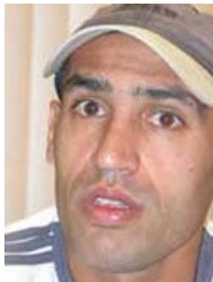
تصویر ۱۹. علیرضا منصوریان، مربی تیم ملی ایران در جام ملت‌های آسیا ۲۰۱۱

سرانجام جام ملت‌های آسیا ۲۰۱۱ در شهر دوحه قطر برگزار شد و پیروزیهای چشمگیری را برای تیم ملی ایران با سرمربیگری افشین قطبی به همراه داشت. لازم به توضیح است که علیرضا منصوریان به عنوان مربی تیم ملی ایران، اصغر حاجیلو به عنوان سرپرست تیم ملی و کریم باقری به عنوان مشاور فنی، افشین قطبی را در جام ملت‌های آسیا یاری می‌کردند.