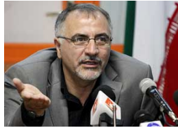
تصویر ۲۱. اصغر حاجیلو، سرپرست تیم ملی ایران در جام ملت‌های آسیا ۲۰۱۱

نتایج این مسابقات در جدولی به شرح ذیل، درج گردیده است.