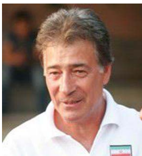
تصویر ۴. ناصر حجازی، اسطوره‌ی دروازه‌بانی استقلال و تیم ملی ایران

لازم به توضیح است که افشین از اوایل نوجوانی با تیم پرسپولیس تهران مأنوس شد بطوریکه گفته است: «فوتبال در روزهای نوجوانی، عشق من و راه زندگی من بود. تیم‌های استقلال و پرسپولیس را دوست داشتم و علی پروین و ناصر حجازی، بازیکنان محبوب من بودند. ۲ »