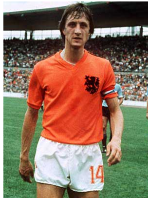
تصویر ۹. یوهان کرایف (Johan Cruyff) بازیکن و مربی هلندی

این رفت و آمدها به هلند باعث شد تا با مربیان بزرگ آنجا آشنا شوم. همچنین از سال ۱۹۹۷ من به همراه بورا میلوتینوویچ توانستیم مشخصات فوتبالیست‌ها را از لحاظ قوای بدنی، تکنیک و تاکتیک‌پذیری به رایانه انتقال دهیم و آنها را برنامه‌ریزی کنیم و در نهایت به صورت تصویری به