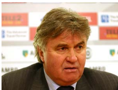
تصویر ۸: گاس هیدینک (Guus Hiddink) مربی هلندی

افشین در مصاحبه‌ای در مورد اینکه چطور در اردوهای مدرسه‌ی فوتبالش به اروپا، با مربیانی همچون یوهان کرایف و گاس هیدینک آشنا شده گفته است: «طی سالهای ۱۹۹۲ تا ۲۰۰۱ من سالی، یک تا یک ماه و نیم از وقتم را در اروپا می‌گذراندم و بازیکنان مدرسه‌ی فوتبالم را به آنجا می‌بردم تا آنان در باشگاه‌های اروپا بازی کنند. طی این سالها رابطه‌ام با تیم آژاکس آمستردام بسیار مطلوب بود. آژاکس از دیرباز، مدرسه‌ی فوتبال معروفی در اروپا داشت و دارد و تفکر ویژه‌ای بر آن حاکم است. بازیکنان معروفی از این مدرسه به سراسر دنیا معرفی شده‌اند که نمونه‌اش ترکیب اصلی تیم ملی هلند در دو جام جهانی ۱۹۷۴ و ۱۹۷۸ و ستاره‌ی بی‌بدیل آنان، یوهان کرایف، بود که مادرش در رختشویی باشگاه آژاکس کار می‌کرد و بعدها نام پسرش را در مدرسه‌ی فوتبال آژاکس نوشت. وقتی کرایف مربی تیم