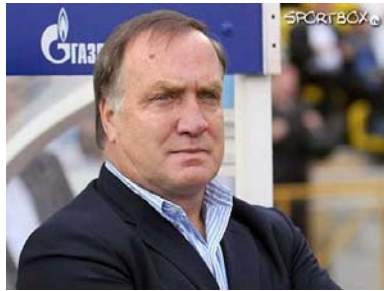
تصویر ۱۱. دیک ادوکات (Dick Advocaat) مربی هلندی

لازم به توضیح است که گاس هیدینک و دیک ادوکات از مربیان معتبر هلندی هستند. هیدینک در جام جهانی ۱۹۹۸ با تیم ملی هلند به مقام چهارم جهان دست یافت و ادوکات در جام جهانی ۱۹۹۴ و جام جهانی ۲۰۰۲ سرمربی تیم ملی هلند بوده، ضمن اینکه ادوکات در سال ۱۹۸۸ تیم هلندی آیندهون را قهرمان لیگ اروپا کرد. ۲