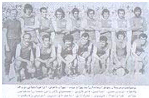
تصویر ۲۵. بازیکنان پرسپولیس در سال ۱۳۵۰

پرسپولیس در سال ۱۳۵۰ با ۱۳ پیروزی و ۱ شکست از ۱۴ بازی جام منطقه‌ای ایران، به نخستین قهرمانی تاریخ خود رسید. دو سال بعد، جام تخت جمشید در سال ۱۳۵۲ بازگشایی شد. در پنج دوره‌ای که از این جام برگزار شد، پرسپولیس همواره از بهترین تیمها بود و به دو قهرمانی در سالهای ۱۳۵۲ و ۱۳۵۴ و سه نایب‌قهرمانی در سالهای ۱۳۵۳، ۱۳۵۵ و ۱۳۵۶ رسید. جام تخت جمشید ۱۳۵۷ نیز در حال انجام بود که با روی دادن انقلاب اسلامی نیمه‌کاره ماند. پرسپولیس در این جام با یک امتیاز کمتر از تیم شهباز، دوم بود.