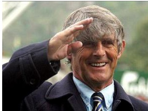
تصویر ۵. بورا میلوتینوویچ (Bora Milutinovic) مربی صربستانی

به جز آموزش فوتبال در مدرسه‌ام، مدیریت این مدرسه هم بر عهده‌ی خودم بود. زحمات زیادی برای آنجا کشیدم. حتی گاهی اوقات پشت تراکتور چمن زنی می‌نشستم و چمنها را کوتاه می‌کردم. برایم مهم نبود که چه کاری می‌کنم، تنها هدفم این بود که مدرسه‌ام با نام افشین قطبی که بعدها به نام AGSS ۱ تغییر نام یافت هدفمند شود و بازیکن بین‌المللی تحویل دنیای فوتبال بدهد. در مدرسه‌ام از تمام دنیا شاگرد داشتم. پس از