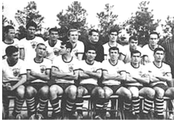
تصویر ۲۴. پرسپولیس در دهه‌ی ۱۳۴۰